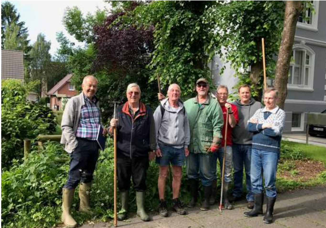
Wasserverband Nettelburg - Mitgliederversammlung 04.10.2017